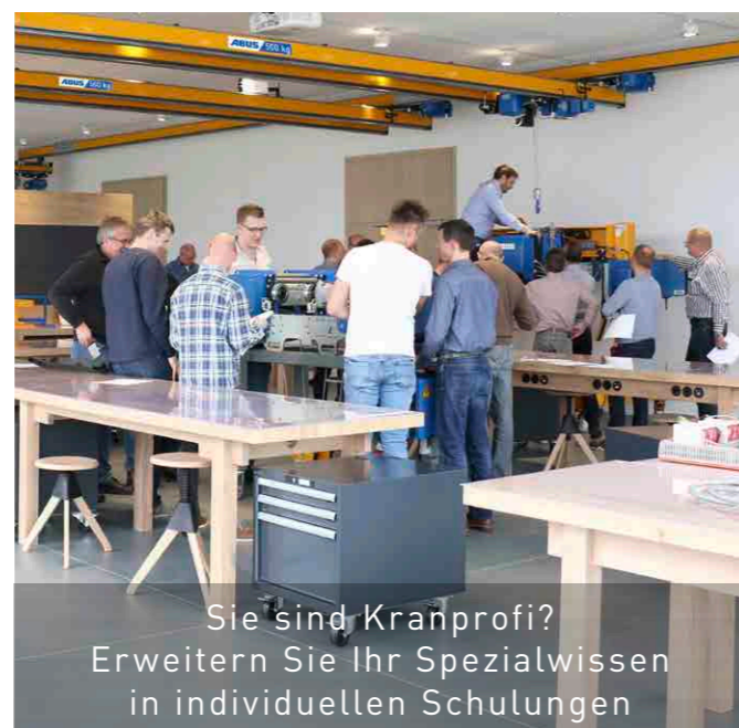
Sie sind Kranprofi? Erweitern Sie Ihr Spezialwissen in individuellen Schulungen