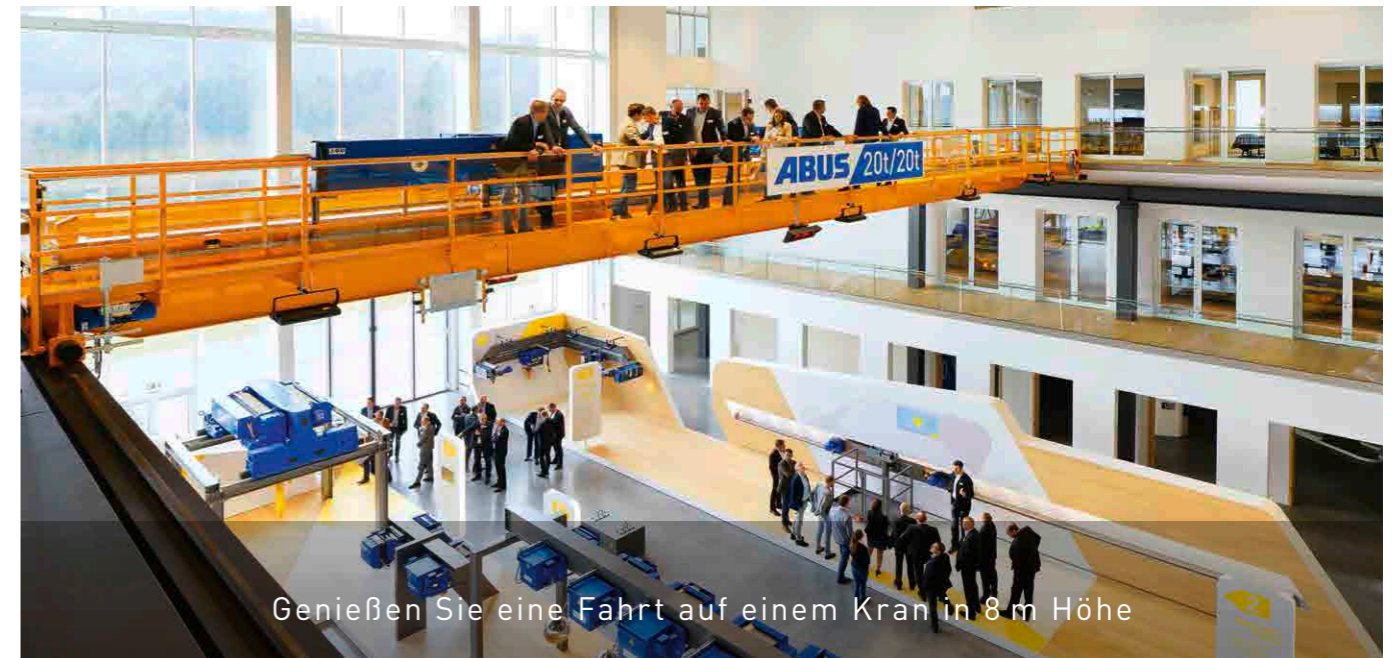
Genießen Sie eine Fahrt auf einem Kran in 8 m Höhe