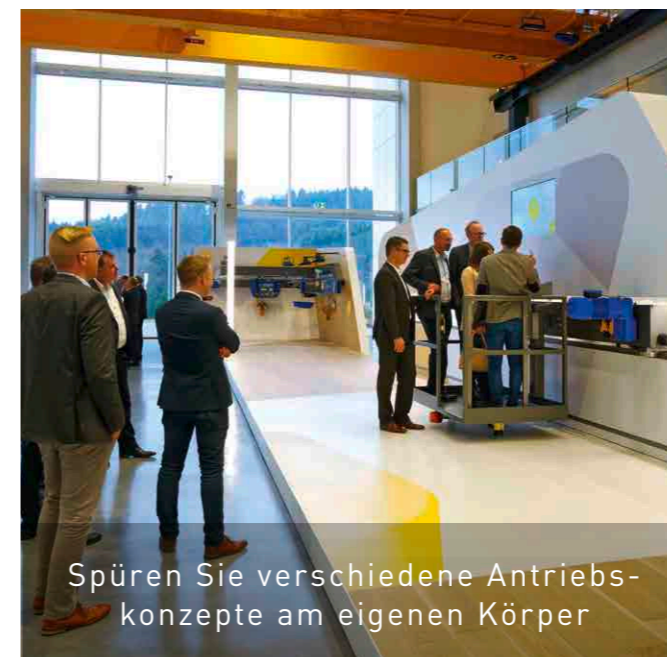
Spüren Sie verschiedene Antriebskonzepte am eigenen Körper