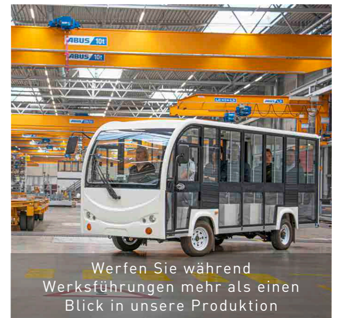
Werfen Sie während Werksführungen mehr als einen Blick in unsere Produktion