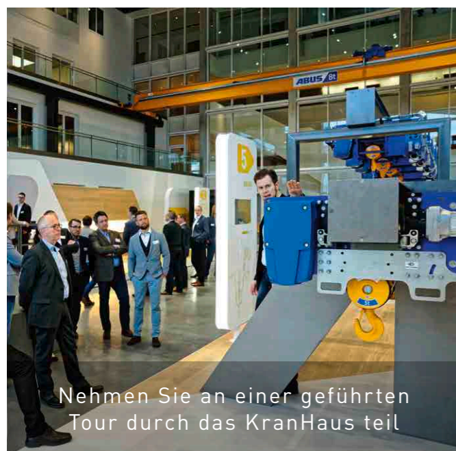
Nehmen Sie an einer geführten Tour durch das KranHaus teil