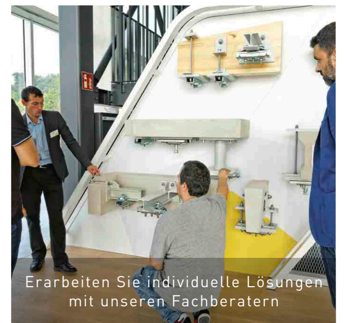
Erarbeiten Sie individuelle Lösungen mit unseren Fachberatern